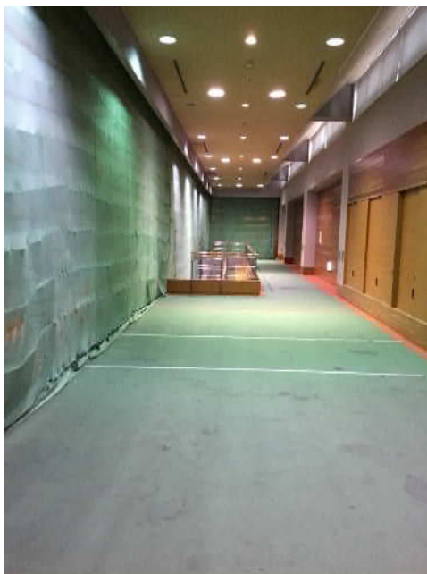
(写真1 アーチェリー場内観)