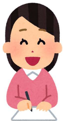
調査開始時の会話例