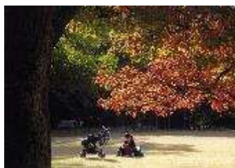
写真の部 「紅葉が照らす命」