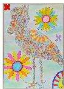
絵画の部 「きょうに輝け ハシビロコウ」