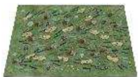
陶芸の部 「おかえり！！ 今年も会えたね！」