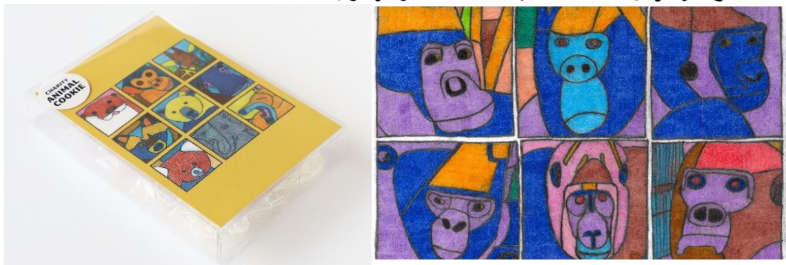
CHARITY ANIMAL COOKIE（クッキー3枚入り、ポストカード付）及び展示作品（予定）

京都市では、「はあと・フレンズ・プロジェクト推進事業」において、障害のある方が制作した「ほっとはあと製品」の販売等を通じ、障害のある方の工賃向上等を目指しています。