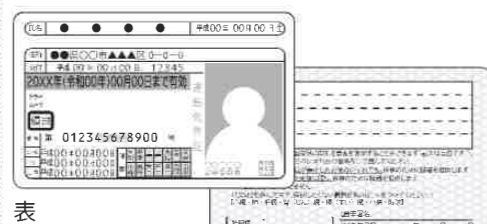
運転免許証のコピー (表裏)