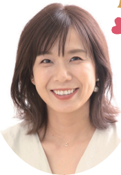
司会 タレント 河島あみる