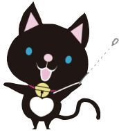
京都動物愛護センター マスコットキャラクター みやこ 都ちゃん

大人も子どもも すべて楽しめる イベントがたくさん！ ペットを飼ってなくても 楽しめる♪