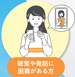
聴覚や発話に 困難がある方