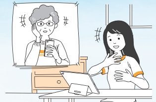
●家族や友人との会話