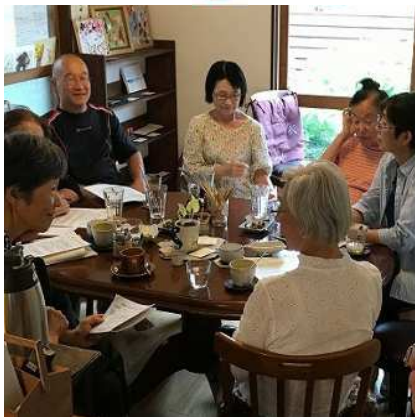
日頃の出来事などを 話すいい機会