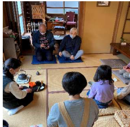
お茶を飲みながら みんなでほっこり