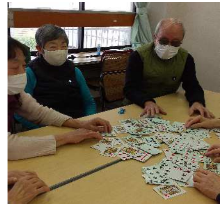
みんなで楽しく ゲームで交流

京都市では、高齢者の皆様が、住み慣れた地域で健康でいきいきとした生活を送ることができるよう、地域の皆様が主体となって設置し、運営する通いの場「健康長寿サロン」への補助制度を設けています。