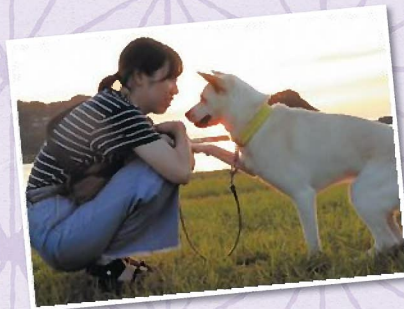
特選 「ネエネエ 夕日きれいだね」