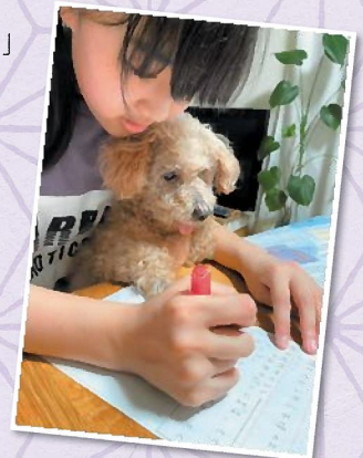
譲渡動物特別賞 「勉強まもりちゅう!!」