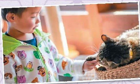
おうちでなかよし特別賞 「通じ合う?」