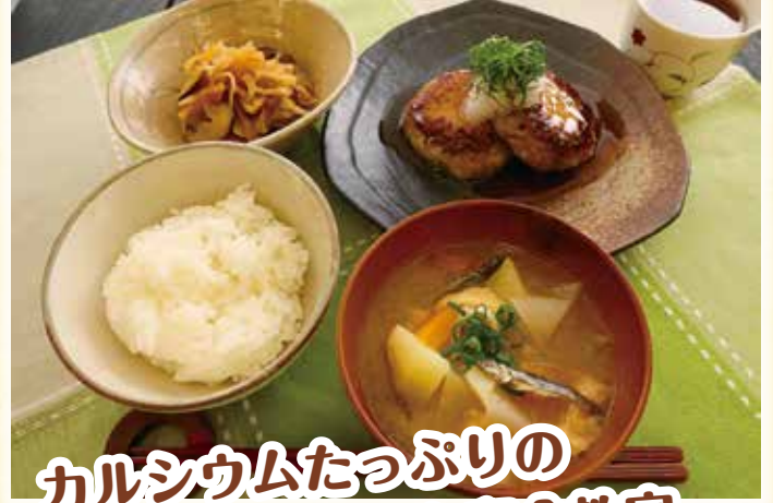
カルシウムたっぷりの 煮干しを使った和食教室