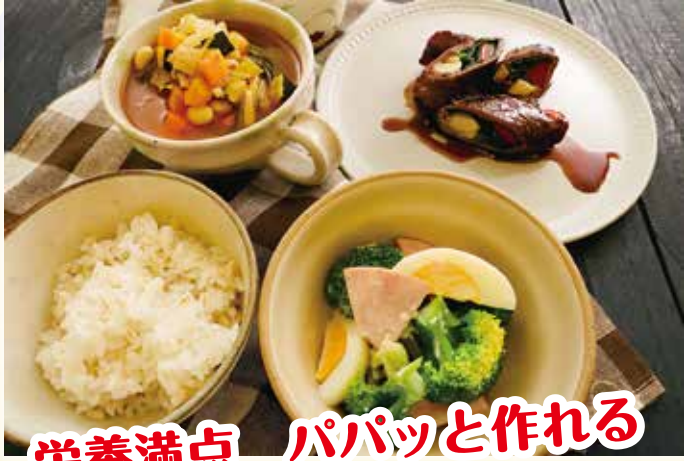
栄養満点 パパッと作れる おうちごはん教室