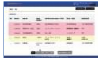
◀報告書登録済みの場合