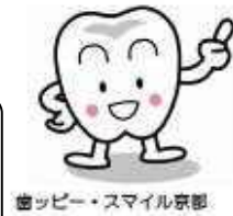
歯ッピー・スマイル京都