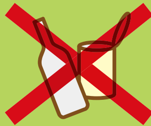
屋外に放置された 空きビン・缶、ペットボトル