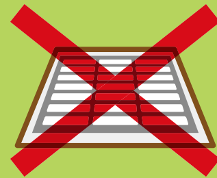
雨水ますや 排水ます

ジカウイルス感染症(ジカ熱)やデング熱の原因となるウイルスは、それらの感染症に感染した人の血を吸った蚊(日本ではヒトスジシマカ)の体内で増え、その蚊がまた他の人の血を吸うことで感染を広げていきます。