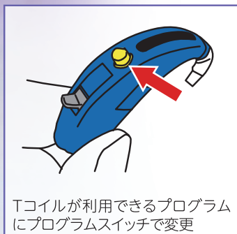
Tコイルが利用できるプログラムにプログラムスイッチで変更