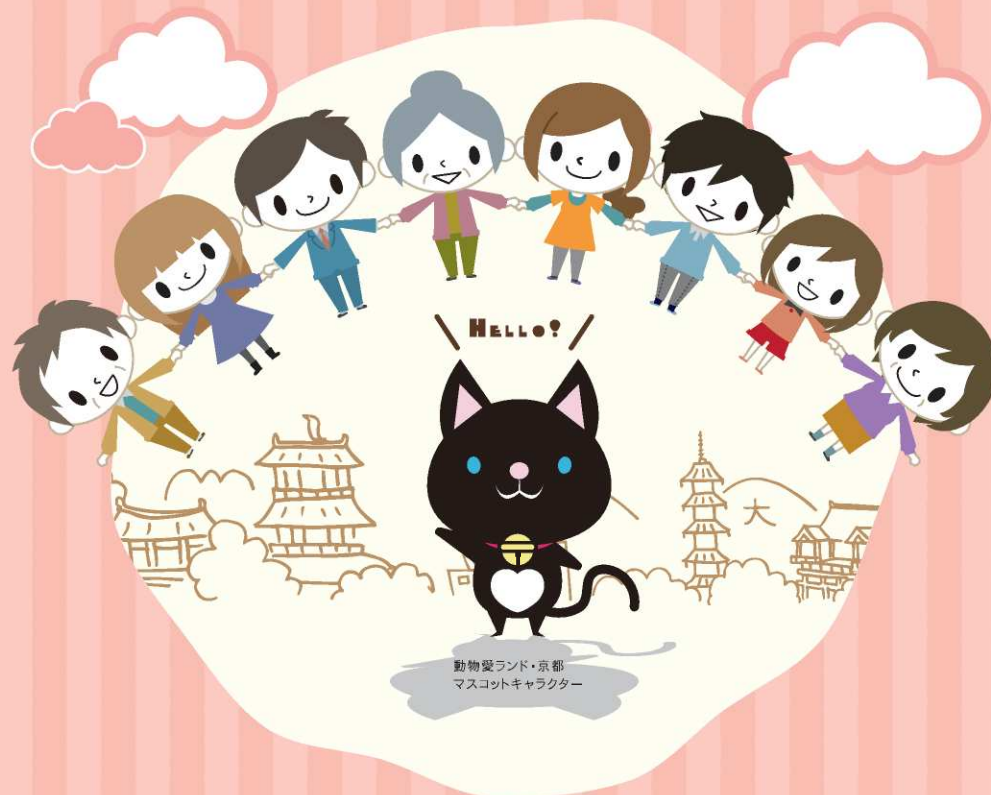
動物愛ランド・京都 マスコットキャラクター