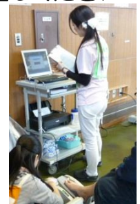
これまでの開催の様子(平成29年2月)