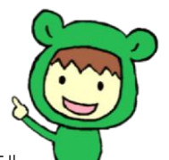
※地域ガエル （PRキャラクター）