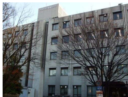
京都市衛生環境研究所

京都市衛生環境研究所と京都府保健環境研究所については、老朽化、狭あい化が共通の課題となっているため、府市間での合意に基づき、効率的な施設運営や健康危機に関する緊急時の対応力の強化に向け、現在の京都府保健環境研究所敷地（元京都府立医科大学伏見診療所跡地を含む）において、両研究所の共同化による整備を実施する。