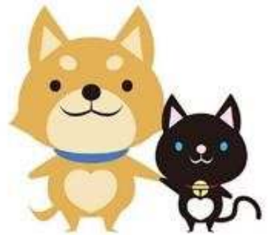
京都動物愛護センター マスコットキャラクター 京ちゃん・都ちゃん

「京都動物愛護憲章」に掲げる「人にも動物にも心地よいまち」の実現を目指し、平成27年7月に施行した「京都市動物との共生に向けたマナー等に関する条例」に基づき、地域ぐるみで啓発活動を展開するとともに、「まちねこ活動支援制度」の推進等を通じて、飼い主等のマナー違反による迷惑事象の防止のための取組を推進する。