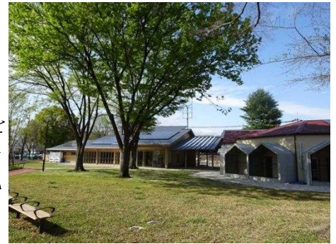
京都動物愛護センター

平成27年4月に設置した「京都動物愛護センター」を京都の動物愛護行政の拠点施設として、関係団体やボランティアスタッフと連携し、全ての犬猫の譲渡・返還を目指すとともに、「京都動物愛護憲章」の普及推進や、犬猫のマイクロチップ装着等、府市共同で広域的な適正飼養に係る普及啓発事業を実施し、「人と動物とが共生できるようなおいのある豊かな社会」の実現に向けた取組を推進する。