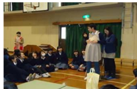
中学校での妊婦体験教室

近い将来、妊娠・出産・育児という親としての役割を担う思春期の子ども達が、心身ともに健やかに成長し、父性・母性を育むことができるよう、大学生ボランティアを活用した中高生対象の体験型思春期健康教育を通じて、次世代を担う意識や、社会全体で妊娠・出産・育児を支える一員としての意識を育む。