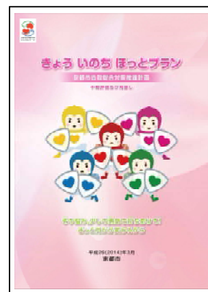
きょう いのち ほっとプラン

平成22年3月に策定した「きょう いのち ほっとプラン」(京都市自殺総合対策推進計画)が平成28年度に終了することに伴い、成果を図る指標の達成状況、平成27年度に実施した市民意識調査結果等から取組を評価し、市民意見募集を踏まえ、今後の自殺予防を総合的に推進していくための第2次計画を策定する。