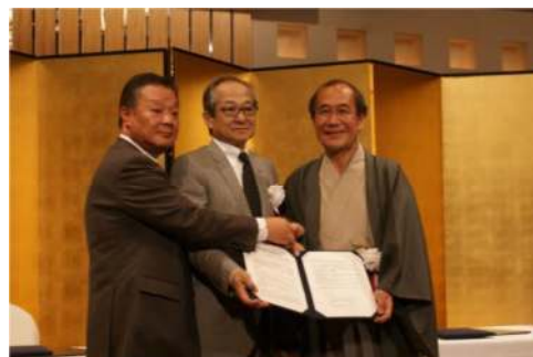
本市・協議会・日本たばこ産業との包括協定

「京都府受動喫煙防止憲章事業者連絡協議会」及び京都府との連携により推進してきた、「店頭表示ステッカー」の取組を更に普及するため、昨年12月に本市、協議会及び日本たばこ産業株式会社で締結した包括協定に基づき、市内全飲食店を対象とした「店頭表示ステッカー」の普及に取り組む。