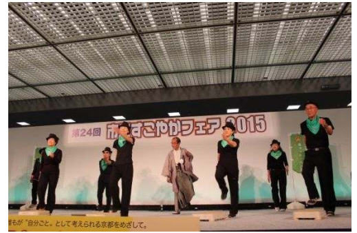
「健康長寿のまち・京都」キックオフイベント (平成27年11月29日)

市民の健康寿命を平均寿命に近づけ、年齢を重ねても、ひとりひとりのいのちが輝き、地域の支え手としても活躍できる、活力ある地域社会が実現できるよう、幅広い市民団体や企業等が参加する「健康長寿のまち・京都市民会議」と連携し、「健康長寿のまち・京都」の実現に向けた目標（キャッチコピー）及びロゴマークを制定するとともに、オール京都で健康づくりの機運を高め、多様な健康づくりの機会の創出に努める。