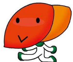
厚生労働省肝炎総合対策マスコット

ウイルス性肝炎患者の重症化予防を推進するため、肝炎ウイルス検査の結果、陽性となった方に対し、検査の受診状況等を定期的にお尋ねするフォローアップを行うとともに、初回精密検査費用及び定期検査費用に係る助成を実施する。