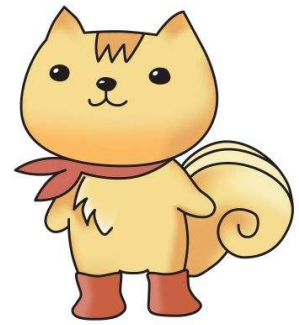
京都市食の安全安心啓発 キャラクター おあがりス