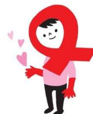
エイズ啓発キャラクター「あかりん」

保健センターでの平日検査及び夜間検査、京都工場保健会での土曜検査の実施により、引き続き市民がHIV検査を受診しやすい環境整備に取り組むとともに、働く世代の感染者が増加していることを踏まえ、企業従事者向けの普及啓発チラシを新たに作成し、検査の受検を広く呼びかける。