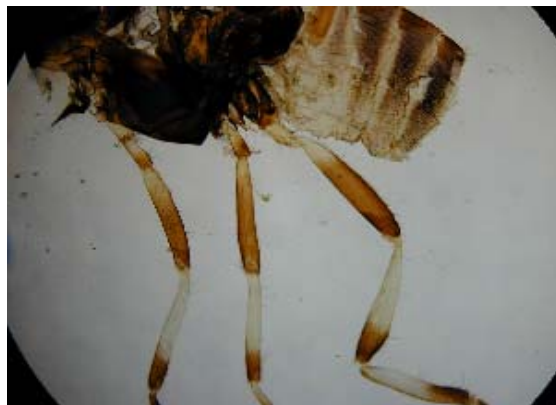
脚(上部)プレパラート標本