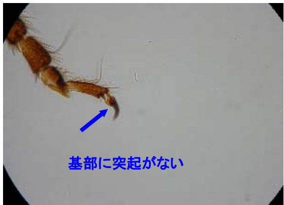
基部に突起がない