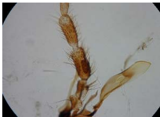
小あごひげ(基部拡大)