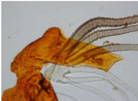
サナギの呼吸系の根元の部分