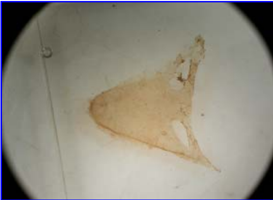
サナギの繭(窓があるのが特徴)