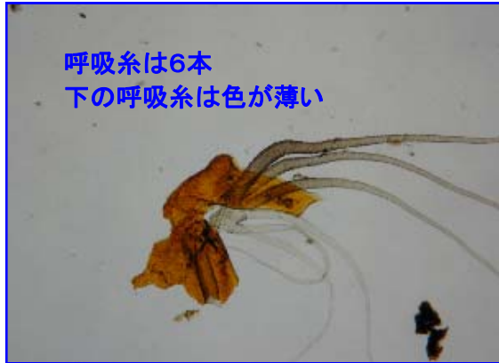
呼吸系は6本 下の呼吸系は色が薄い