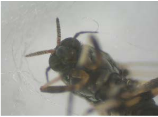
触角(基部の着色が薄い)