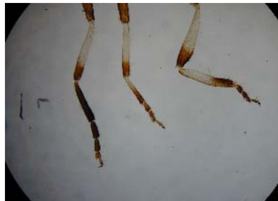
脚(下部)プレパラート標本