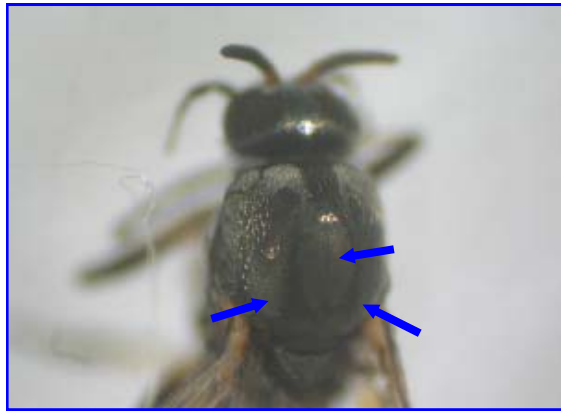
胸背(黒色の模様が特徴)