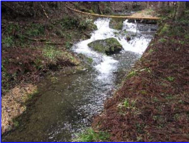
京都市左京区広河原 上桂川支流