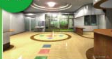
エントランス ホール

エントランスホールは間接照明や木目基調の受付カウンターなどを配置し、柔らかさを演出した空間にしております。隣接している地域交流ホールの壁面は可動式となっており、取り外すことでエントランスホールと一体でご利用いただけます。