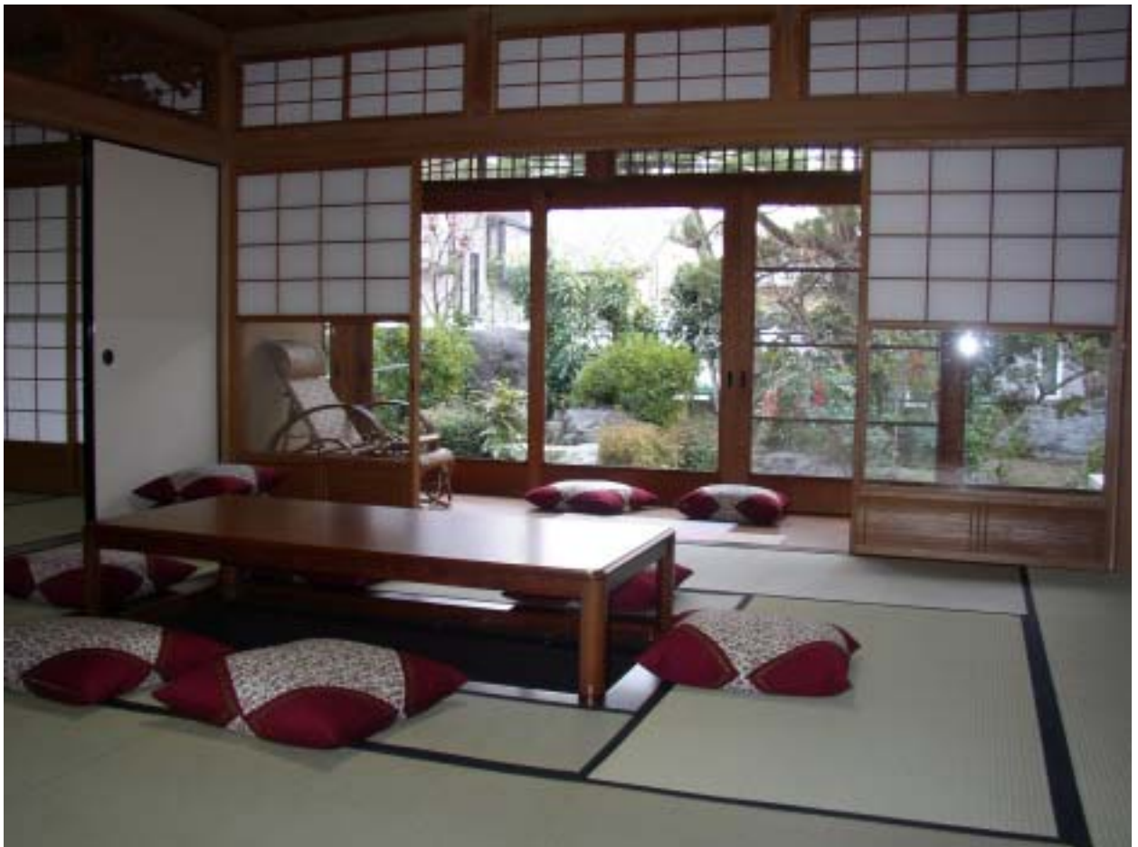
写真上：「ガーデンハウス西賀茂」外観