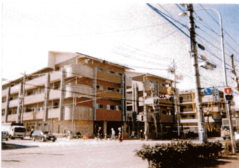
特別養護老人ホーム「ビハーラ十条」全景