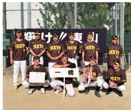
一般の部 優勝：一橋/準優勝：月輪