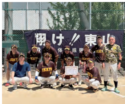
壮年の部 優勝：一橋/準優勝：今熊野