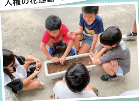
人権の花運動 (勸修小学校)