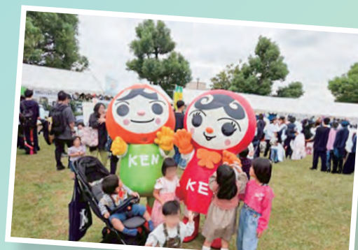
右京区民ふれあい文化フェスティバル2025