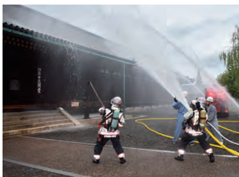
三十三間堂での合同消防訓練の様子