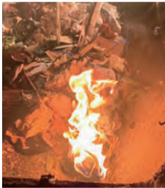
東北部クリーンセンターの火災被害状況