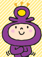
市広報マスコット ミツケ

市政協力委員は、市民主体のまちづくりには欠かせない存在。委員の仕事に加え、地域での顔の見えるつながり作りも行っているんですよ。