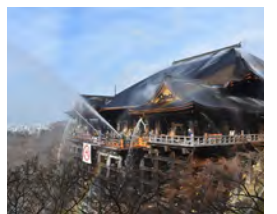
過去の合同消防訓練の様子