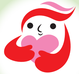
犯罪被害者等支援シンボルマーク 「ギョットちゃん」

京都市では、「京都市犯罪被害者等支援条例」に基づき、社会全体で犯罪被害者を支え、安心して暮らせる地域社会の実現を目指して、各種啓発事業等に取り組んでいます。