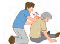
成人・小児の場合