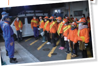
↑12月 お楽しみ会・年末巡回広報