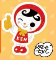
人権イメージ キャラクター 人KENあゆみちゃん