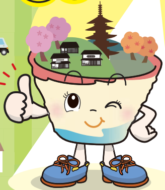
東山区マスコットキャラクター「ひがしちゃん」

これまで5年間の設置促進事業で、 96台 のセンサーライトが区内に設置されました!