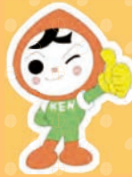
人権イメージ キャラクター 人KENまもる君