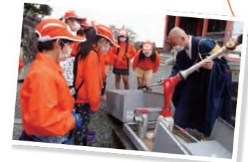
↑11月 清水寺・防災施設見学