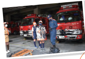
↑6月 入退団式・消防署見学