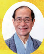
京都市長 門川大作