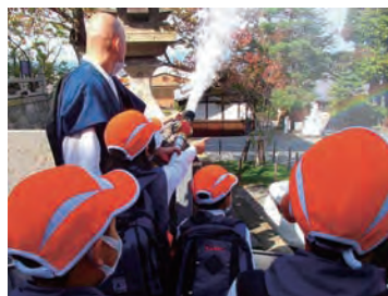
清水寺での放水訓練の風景