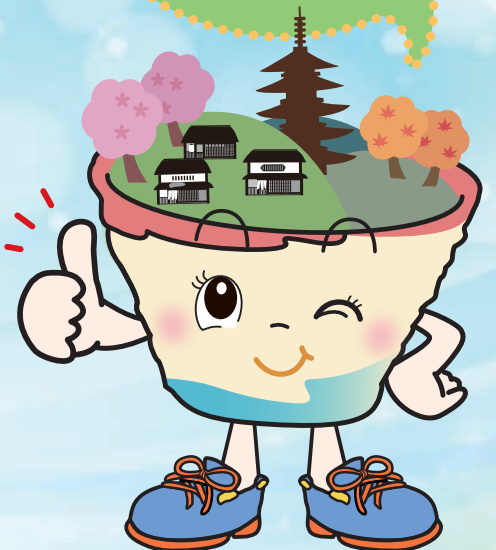
東山区マスコットキャラクター 「ひがしちゃん」