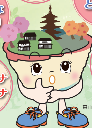
東山区マスコットキャラクター「ひがしちゃん」