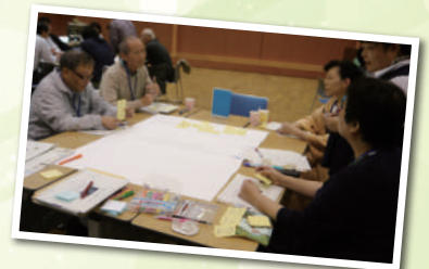
共汗ワーキングの様子