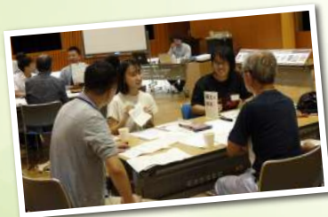
まちづくりカフェ@東山の様子