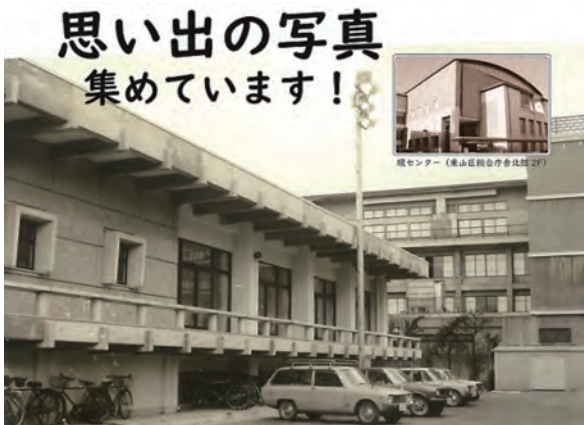
※令和3年1月末日まで随時受付

昭和46年(1971年)2月1日にオープンした京都市東山青年の家(勤労青少年ホーム)は、平成13年(2001年)に現在の場所に移転し、名称を東山青少年活動センターに変え、今年で開館50周年を迎えます。その記念事業として、旧青年の家の外観写真、建物内の写真、講習会や行事の風景など、思い出の写真を募集しています。集まった写真はロビーに展示し、モザイクアートを作成します。詳細はお問い合わせください。