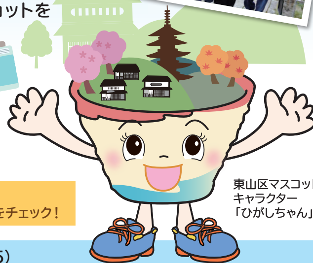
東山区マスコット キャラクター 「ひがしちゃん」