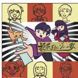
このジャケットが目印です!

東山区選挙管理委員会は、高校生や子どもが演奏、合唱した区オリジナルの選挙啓発の歌「投票するんジャーの歌」のカバー・バージョンを収録したオリジナルCDを発表します。