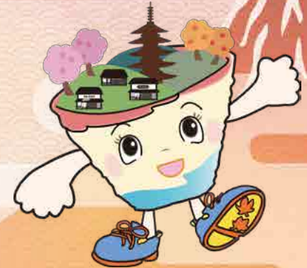
東山区マスコットキャラクター ひがしちゃん