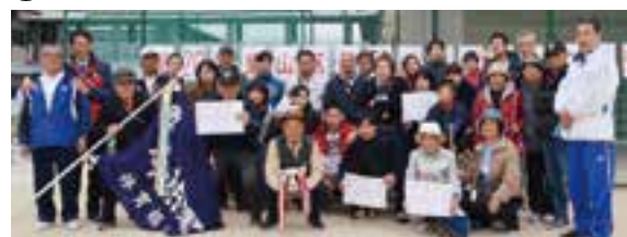
総合優勝 今熊野学区のみなさん

第20回東山区民 ニエースポーツフェスティバル結果 (11月18日開催) 3つの種目で競い合うとともに参加者同士の親睦を深め、穏やかな秋の一日を楽しみました。結果は次のとおりです。