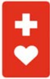
障害保健福祉課 窓口で配布中