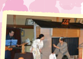
京のまち 寸劇 大絵巻