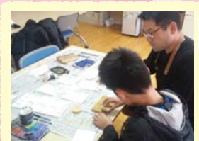
障害者の京からかみ ポストカード作り体験会