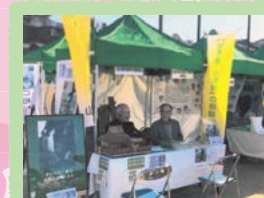
空き家・ゲストハウス・民泊に関する取り組み