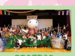
未来の運動会を 京都でやろう