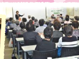
認知症予防と食生活の講演会