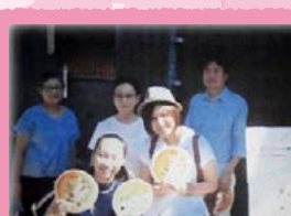
祇園町南側地区マナーアップキャンペーン