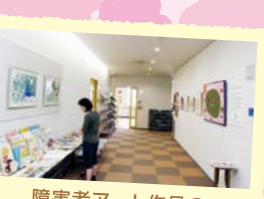
障害者アート作品の 展示・紹介