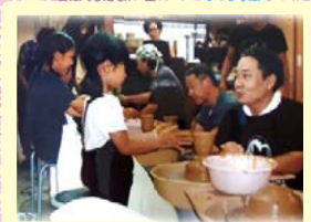
日吉窯元まつり 陶芸体験・窯元見学

東山区まちづくり支援事業は地域活性化や課題解決の取り組みに対して助成金を交付して、その活動を応援しています。