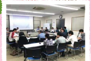
民泊のあり方と路地の防災力向上