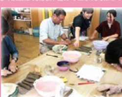
しゅうき 鍾馗ツアーと 鍾馗さんづくり