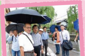
空き家・空き店舗の活用によるまちづくり