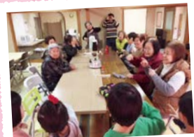
野菜作りを中心とした多世代交流