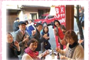
外国人観光客向け地図と おもてなしカードの作成