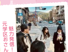
魅力発信! 元学区おさんぽ