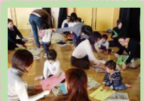
アートであそぼう ぶれい、ひがしやま!