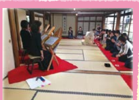
お茶会と 音楽のハーモニー事業