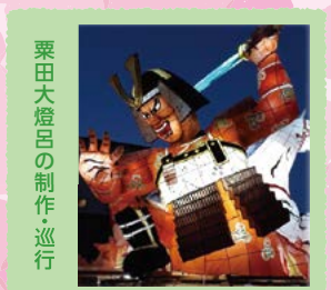
粟田大燈呂の制作・巡行