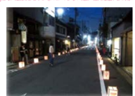
空き家活用のルールづくりと 元町の灯り