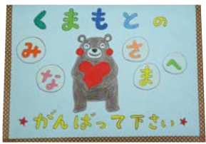
園児たちからのメッセージ