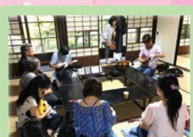
おてらカフェ in 金剛寺