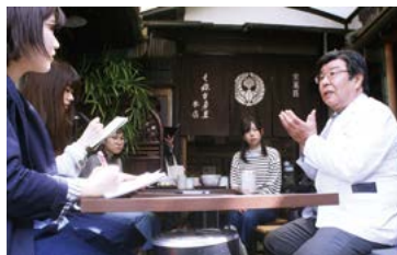
七條甘春堂取材風景

京都という土地柄から東山区には多くの和菓子屋が並んでいます。今回は、私たちが通う京都女子大学から近い2軒のお店にスポットを当ててみました。