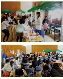
昨年の盛り上げりの様子

応募期間 1月20日(金)～2月17日(金) 主催 東山区民ふれあい事業実行委員会 問合せ 地域力推進室 (☎561・9114、FAX541・7755) Eメール: higashimachi@city.kyoto.lg.jp