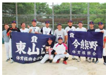
今熊野チーム(一般)