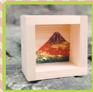
作品名「もつかります」 協力職人…おけ職人と漆絵職人

主催 手しごと職人のまち東山活性化プロジェクト 後援 京都造形芸術大学プロジェクトセンター・東山区役所 問合せ 【コンテスト】 区地域力推進室 (☎561-9114) 【その他イベント】 京都造形芸術大学プロジェクトセンター (☎791-8763)