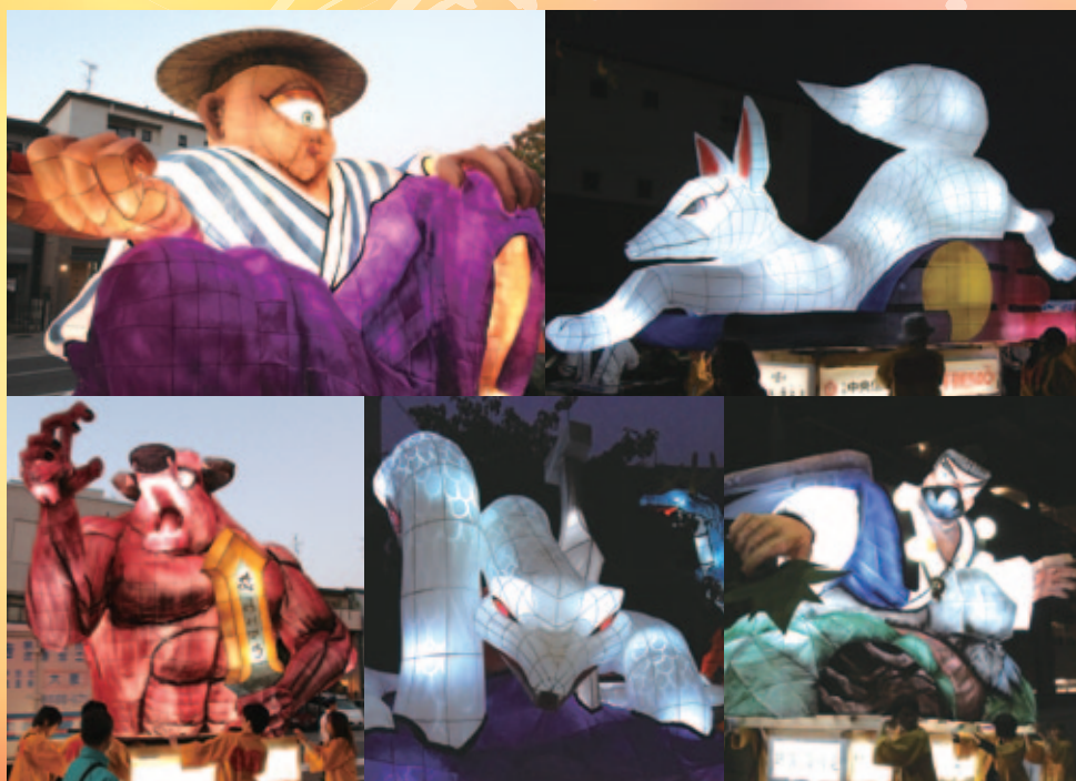
今年巡行する、一つ目小僧、合槌稲荷、牛頭天王、八岐大蛇、烏天狗の大燈呂。この他、出世えびす、大巴貴、光秀と狛犬、青龍、末の大燈呂も巡行します!