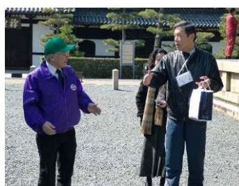
高齢者見守り活動（高齢者が外出する機会をつくるための事業提供）