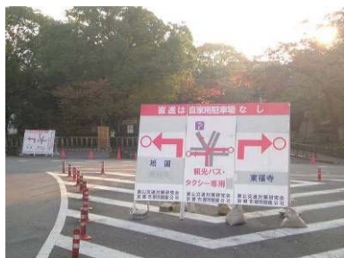
東山交通対策の取組