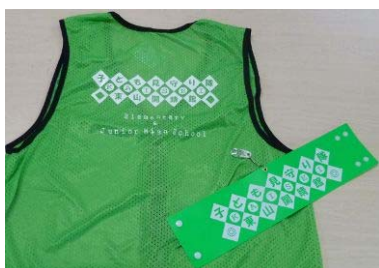
子ども見守り活動