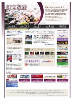
東山区来訪者向けホームページ 「歩いて楽しむ東山」