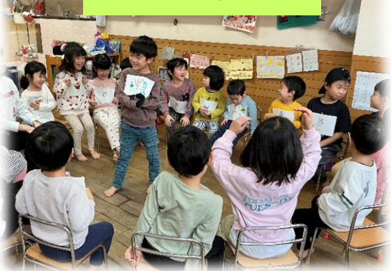
フルーツバスケット!