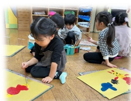
鬼のツノをぺたぺた