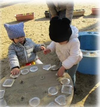
氷がたくさんできた!