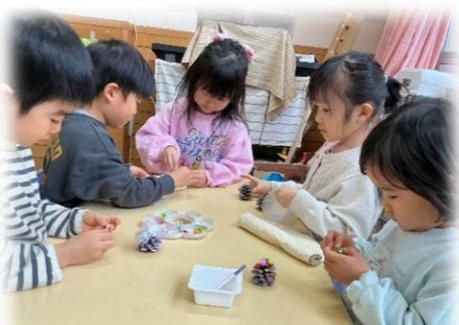
松ぼっくりツリーを作るよ