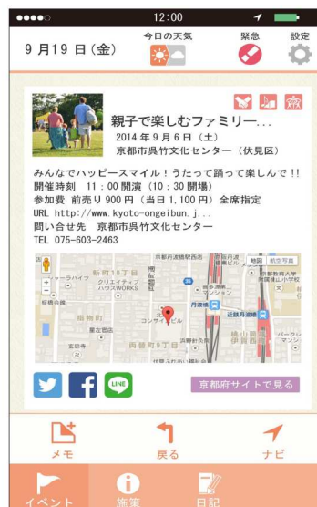
イベント詳細画面