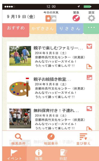
イベント一覧画面

参加したいイベント等を、メモ機能を使い登録をしておけば、イベント開催日に再度通知が届きます。