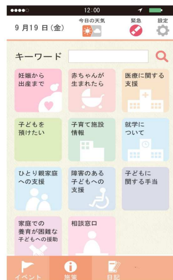
子育て支援施策検索画面