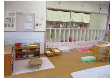
すくすくの部屋 （乳児棟2F）