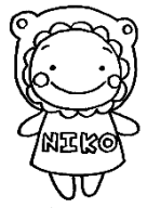
にこにこオリジナルキャラクター にこたん