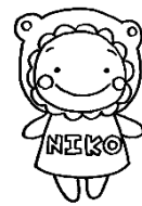
ここにオリジナルキャラクター にこたん