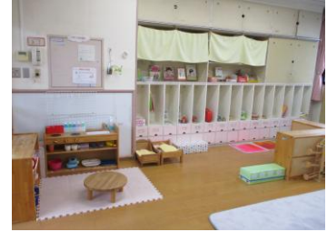
すくすくの部屋 （乳児棟 2F）

◎申込不要です。すくすくの部屋、ホール、絵本の部屋、園庭などで、親子でゆっくりと遊ぶことができます。