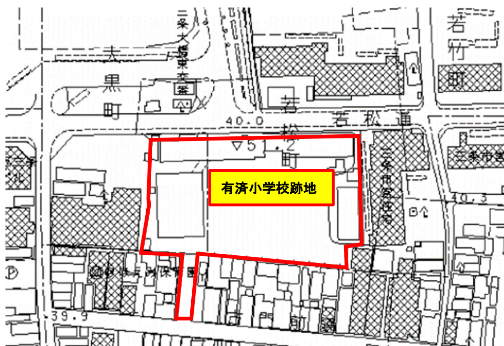
京都市都市計画情報等検索ポータルサイト地図引用