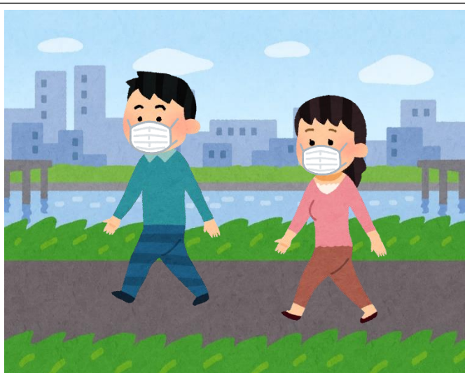
自宅周辺等における 散歩・ジョギング

マスクの着用，手洗い，身体的距離の確保，3密の回避などの 基本的な感染症対策を徹底したうえで，例えば・・・