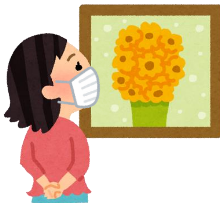
感染防止対策が講じられた美術館、 コンサートホール・スポーツ施設 等での文化芸術・スポーツ鑑賞